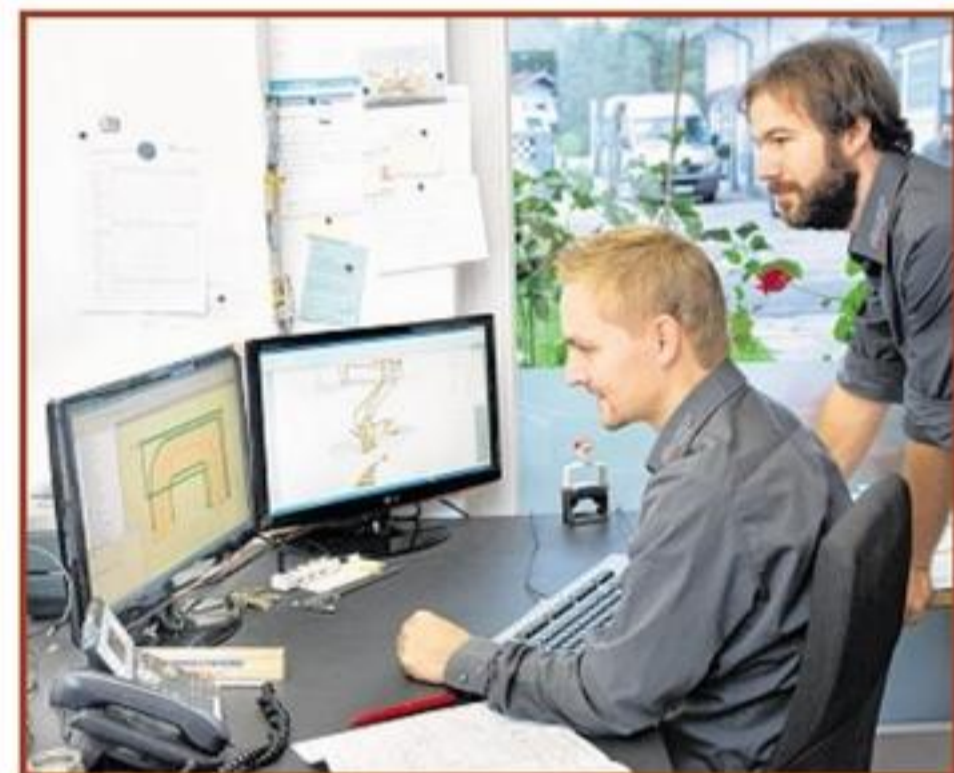
Die zwei jungen Chefs bei der Auftragsbesprechung.

Termine für ein persönliches Beratungsgespräch können gerne unter Telefon 08051/3611 oder per E-Mail an info@friedrich-treppenbau.com vereinbart werden. Mehr unter www.friedrich-treppenbau.com .